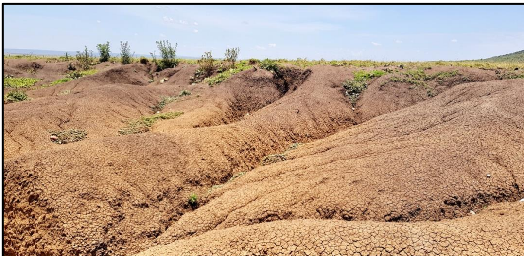
Met name rond Lemek is veel water-erosie