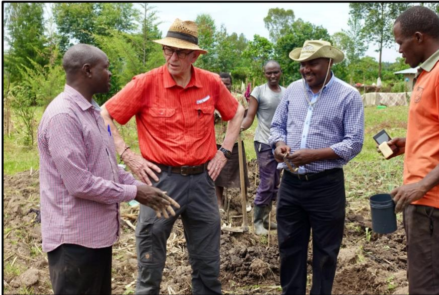
Bezoek aan Boeren-Solidarity-groep in Abossi

Via de afdeling Landbouw van het Katholieke Bisdom Ngong zet de Katholieke Kerk van de Heilige Drie-eenheid Abossi zich in om de voedselzekerheid in ons gebied te verbeteren door