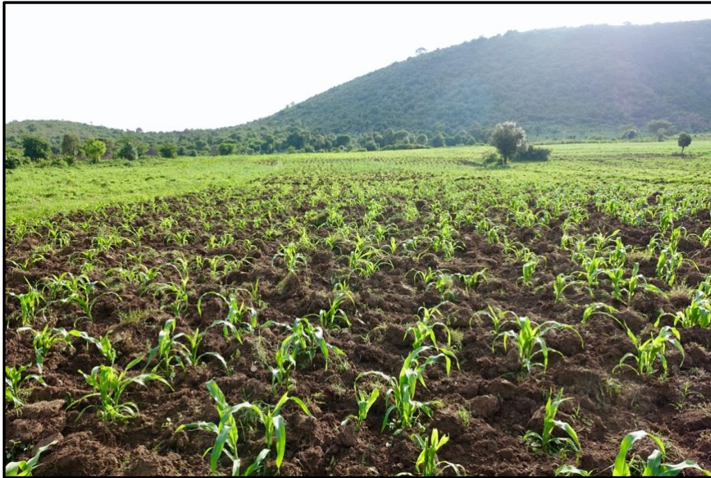
In de Kimani-valley bij Lemek ligt rijke boerengrond

Stichting Kupanda2Grow is opgericht op 10 november 2020. Daarna wordt gezorgd voor de ANBI-status waaraan dit beleidsplan bijdraagt. De fondsenwerving is in volle gang en we hebben van Wilde Ganzen de toezegging dat de geworven middelen voor het Landbouwproject met 50% worden aangevuld. We streven naar de start van projecten in de loop van 2021. Onze website is in volle ontwikkeling; we hopen die in december 2020 in de lucht te hebben.