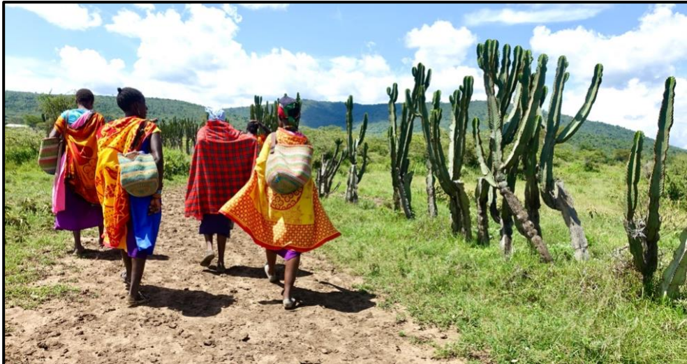
Kleurrijke Masaai-vrouwen uit de omgeving gaan shoppen in Lemek.

Vanaf oktober-2020 vergaderden we digitaal vanwege de Covid19-pandemie.