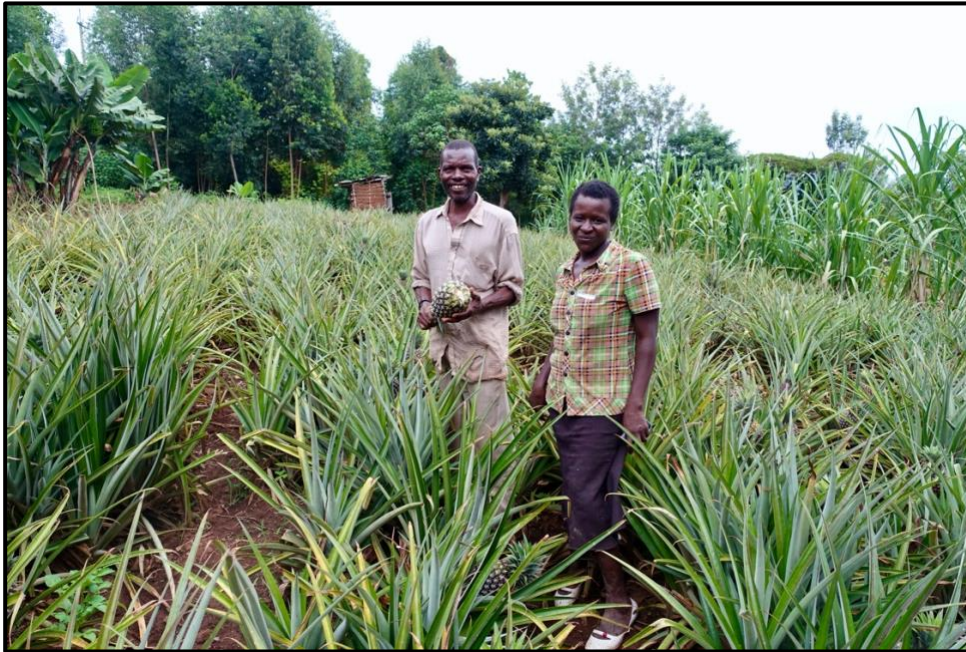
Een rijke ananas-oogst ligt in het verschiet.