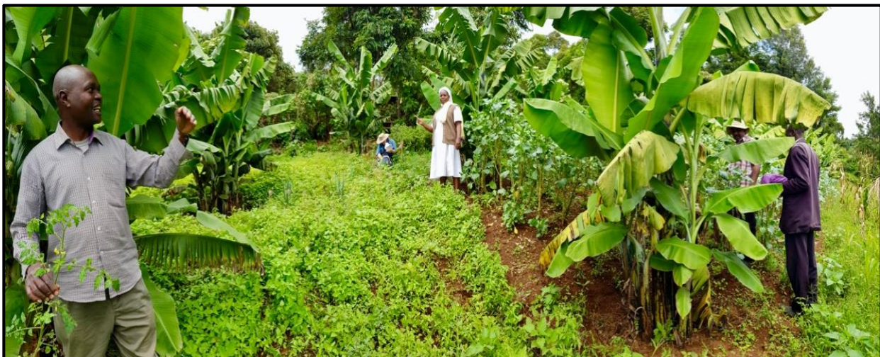
In de omgeving van Abossi ligt prima grond en het regent overvloedig.

Schematische voorstelling van het overkoepelend Landbouwproject voor Abossi en Lemek. Dit is ontwikkeld in samenwerking met de Global Agriculture Foundation (GAD) en ProDairy.