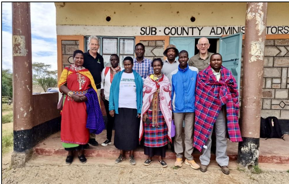
Het energieke Boerenbondbestuur met in het midden haar vrouwelijke(!) voorzitter.