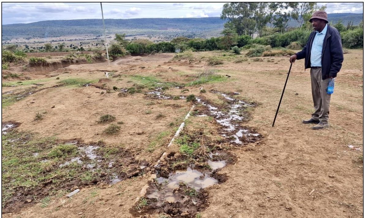
Deze leiding ligt op het maaiveld en is daardoor kwetsbaar. Olifanten uit de Massai Mara, op zoek naar water en mais vertrappen deze. Dus de grond in.