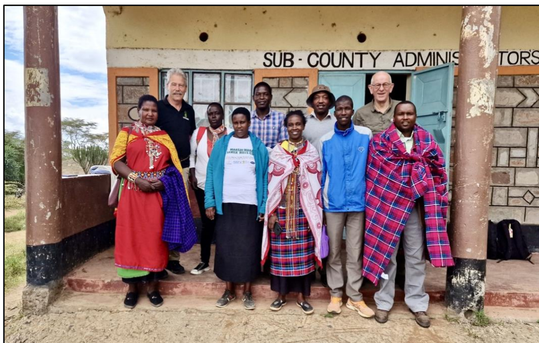
Het energieke Boerenbondbestuur met in het midden haar vrouwelijke(!) voorzitter.

Bij de evaluatie van onze bezoeken aan de zeven kernen binnen Lemek bespraken we welke follow-up voor maximaal effect in 2023 binnen het FA2T-project het best kan plaats vinden. Daarbij zullen de thema's water en ruwvoederwinning/silage voorop staan. De evaluaties van de traingen met leden van de boerenbond leveren een heel positief beeld. Er is veel kennis en kunde opgenomen. Het rendement van de trainingen had echter nog hoger kunnen als de vee-sterfte vanwege de droogte een aantal boeren verhinderde op tijd bij de training te zijn. Ze moesten prioriteit geven aan hun van de been geraakte, stervende koeien. We worden in dat verband ontzettend bedankt voor onze voedselhulp aan de allerarmsten. Onder de trainees waren de ouderen, ondanks hun vaak gebrekkige Engels, goed vertegenwoordigd. Dit blijkt een voorwaarde tot een goede follow-up omdat die groep, zeker in de Massaal-cultuur, op het bedrijf de beslissingen neemt. Daardoor moest er door de jongeren extra worden ingesprongen als vertaler. Ook dit was oorzaak voor een minder trainingsrendement. Toch is het Bestuur positief omdat de trainers erin geslaagd zijn om een extra hoge motivatie en solidariteit te realiseren. Dit zal bijdragen aan een nog betere verwerking en toepassing van het geleerde .