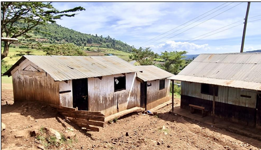
De Colling Davis Primary School

We hadden een ontmoeting met ca. 20 leden van de CBO-Mulot i.o. Die willen graag aansluiten bij het K2G-project FA2T. We gaven hen info over FA2T en zullen in de loop van 2023 besluiten of we op hun verzoek ingaan. Hieronder de foto van de in de deplorabele school in Mulot waarvoor ook onze steun wordt gevraagd. Voorlopig kunnen we die niet honoreren en zullen we moeten verwijzen naar andere NGO's.