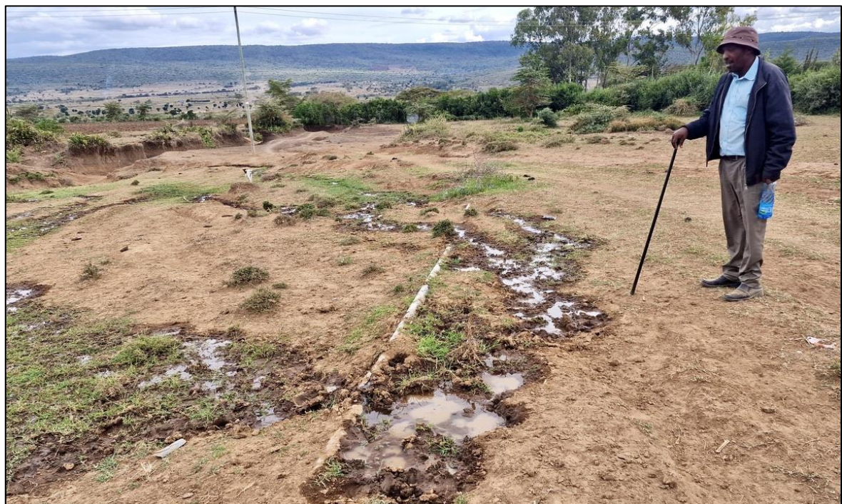
Deze leiding ligt op het maaiveld en is daardoor kwetsbaar. Olifanten uit de Massaai Mara, op zoek naar water en mais vertrappen deze. Dus de grond in.